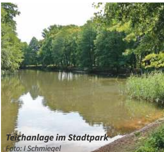
Teichanlage im Stadtpark