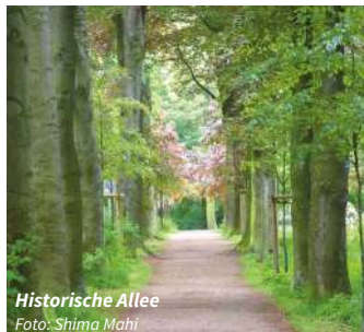
Historische Allee