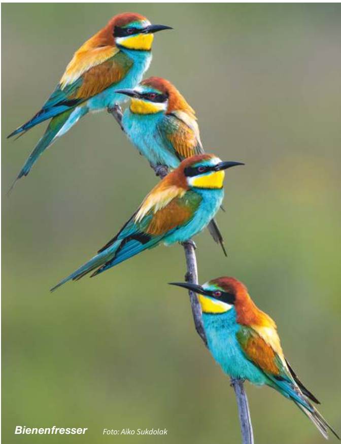
Bienenfresser