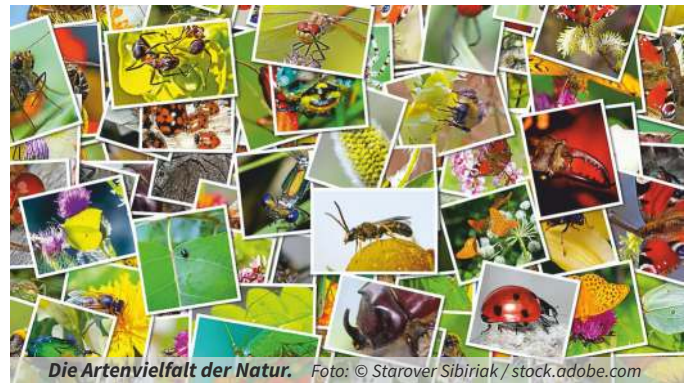
Die Artenvielfalt der Natur.

E-Mail: georg.obermayr@nabu-langenhagen.de