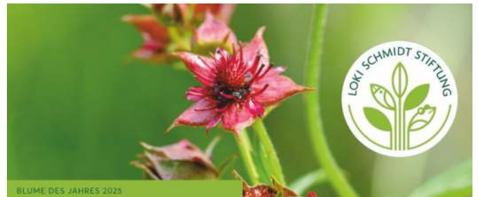
BLUME DES JAHRES 2025

oder per E-Mail: kontakt@kirstenheitmueller.de