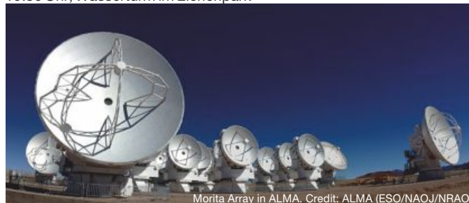
Morita Array in ALMA.