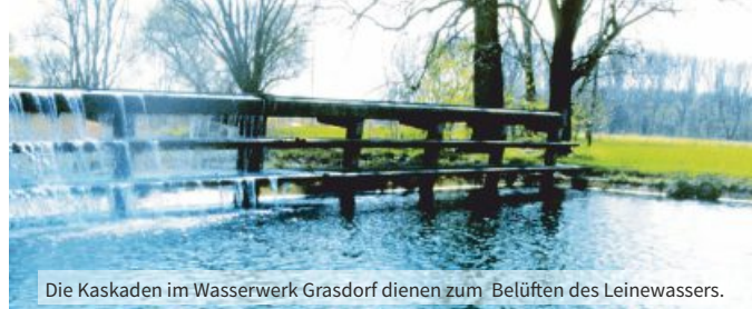
Die Kaskaden im Wasserwerk Grasdorf dienen zum Belüften des Leinewassers.

Anmeldung bis zum 10.10.2018 bei Fam. Ratsch, Tel.: 0511/731959