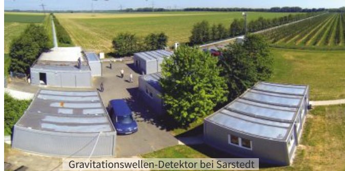
Gravitationswellen-Detektor bei Sarstedt